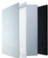
Vorfilter » MediaMax Filter » Aktivkohlefilter

Phase 3: letztendlich absorbiert der Aktivkohlefilter unangenehme Gerüche, wie zum Beispiel von Zigaretten und Zigarren.